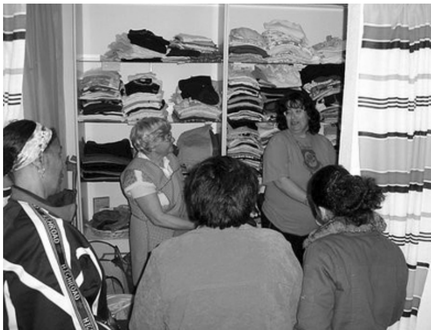
Atendimento no “Nova Esperança”