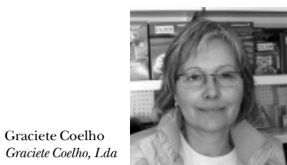
Graciete Coelho Graciete Coelho, Lda

Esta remodelação pode ajudar à reanimação da Rua 1º de Maio, embora possa trazer os inconvenientes que já referi. Eu sou adepto das ruas sem trânsito, gosto de ver noutras localidades, também gostaria de ver à minha porta.