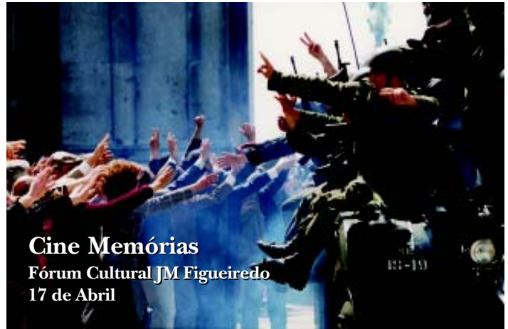
Cine Memórias Fórum Cultural JM Figueiredo 17 de Abril