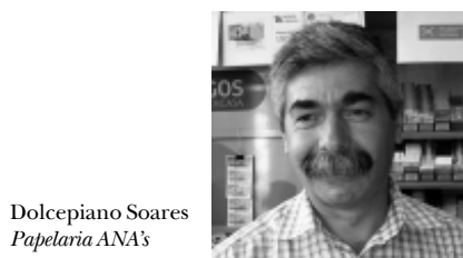
Dolcepiano Soares Papeleria ANA's

Questionámos comerciantes da Rua 1º de Maio, na Baixa da Banheira, sobre o que achavam da requalificação da rua. Eis as respostas: