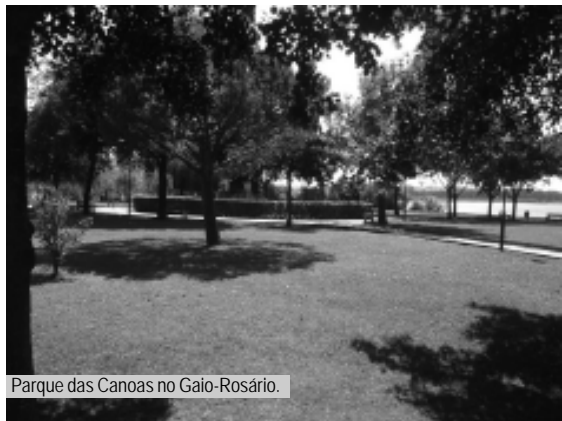
Parque das Canoas no Gaio-Rosário.

No final da tarde o Projecto Ideias Ambientais e a Junta de Freguesia oferecem um lanche aos participantes.