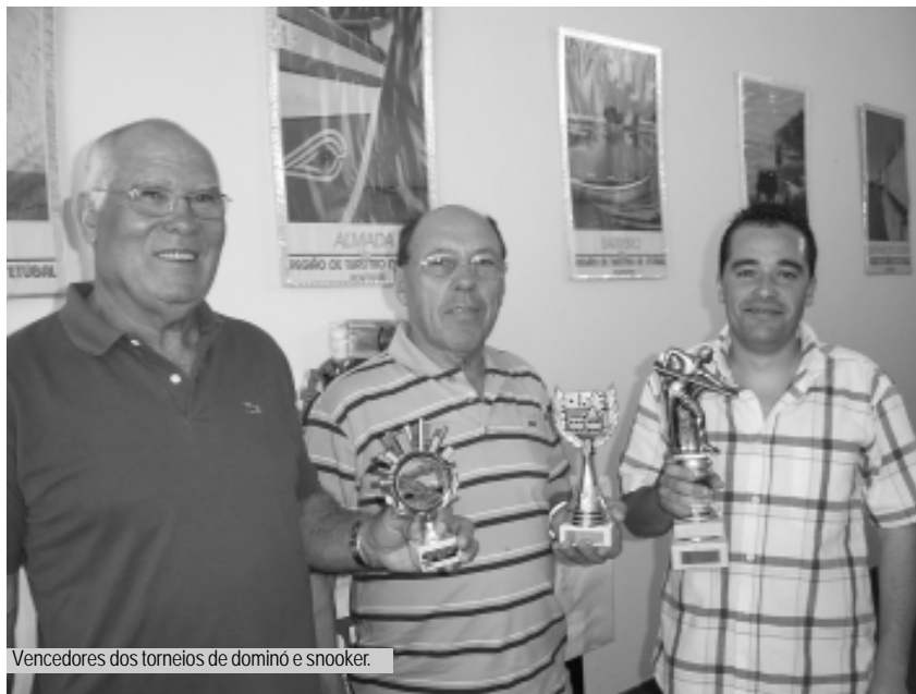
Vencedores dos torneios de dominó e snooker.