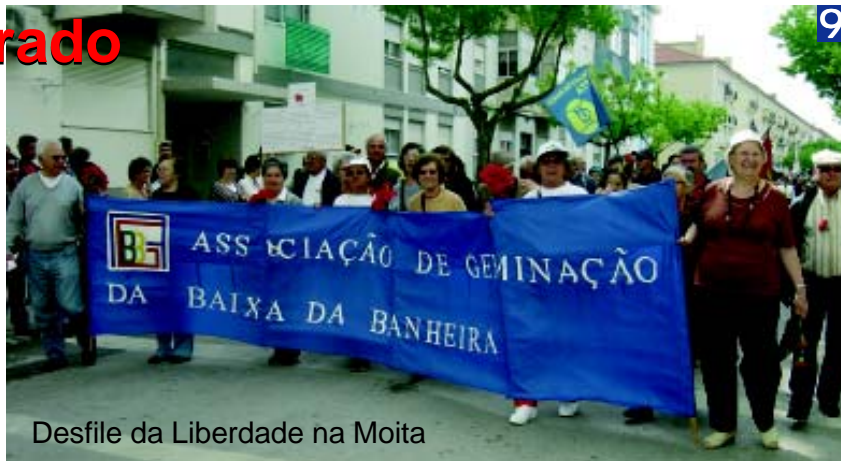
Desfile da Liberdade na Moita

No dia 25 de Abril, pelas 10.30 horas, realizou-se o Desfile da Liberdade que juntou o movimento associativo, as autarquias e a população em geral. O desfile, encabeçado por eleitos locais, partiu do Largo do Mercado, percorrendo a Av. Alexandre Sequeira e Teófilo Braga, até à Praça da República, frente ao edifício da Câmara Municipal, com muitos participantes e bastante gente a assistir.