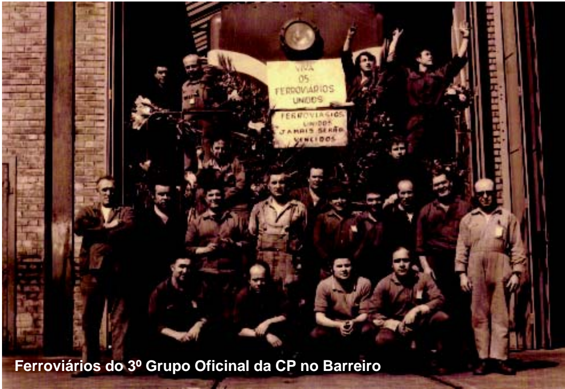
Ferroviários do 3º Grupo Oficinal da CP no Barreiro