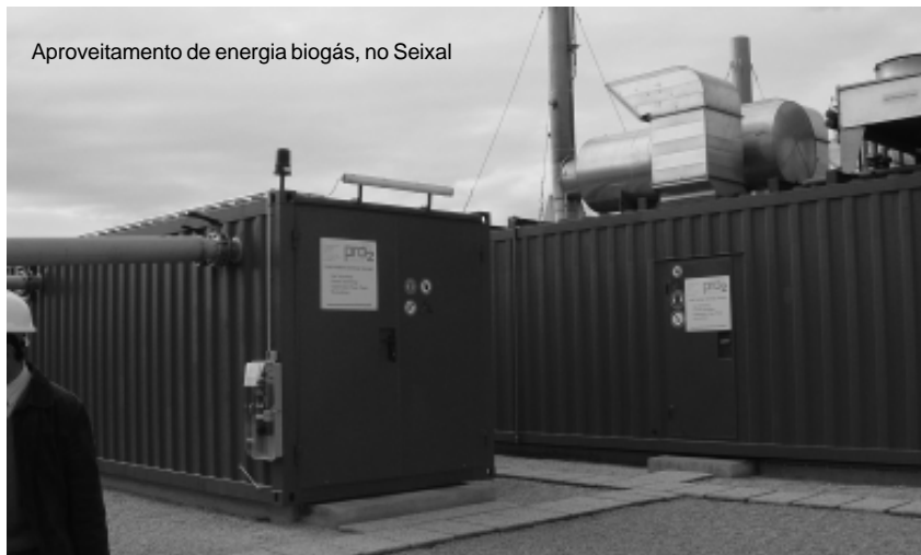
Aproveitamento de energia biogás, no Seixal