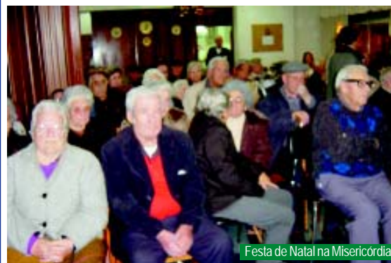
Festa de Natal na Misericórdia.