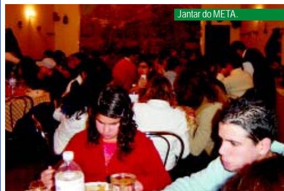
Jantar do META.