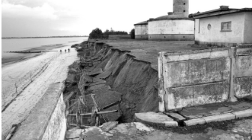
Derrocada da muralha

Entretanto, a Câmara Municipal da Moita também tem alertado as entidades responsáveis pelo Centro de Depuração de Ostras para a degradação do imóvel, inclusive propõe a conversão daquele espaço num Centro de Investigação das Potencialidades e do Controlo do Meio Ambiente do Estuário do Tejo.