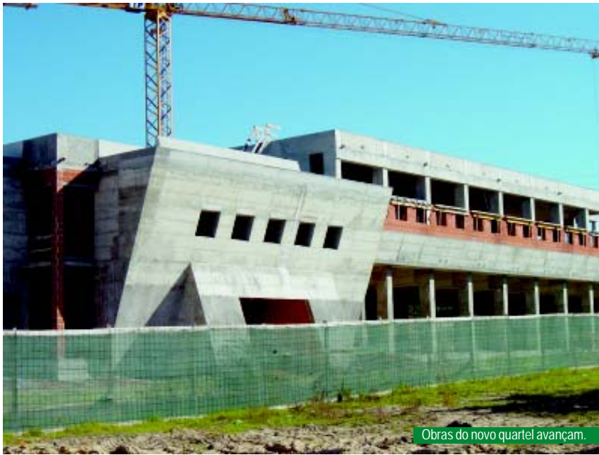
Obras do novo quartel avançam.

A autarquia passa a atribuir um subsídio anual à corporação, de 99 800 euros, até ao final do mandato, de modo a dotar a corporação de meios financeiros, que permitam uma melhoria dos serviços que têm vindo a ser prestados.