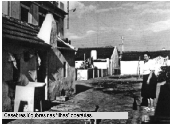
Casebres lúgubres nas "ilhas" operárias.

Não havia alaridos, mãos solidárias e uma garrafa de água «cho-ca» faziam o milagre do regresso à consciência, pouco celebrado: