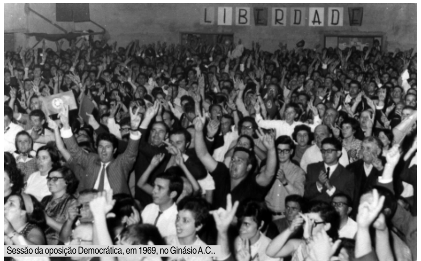
Sessão da oposição Democrática, em 1969, no Ginásio A.C..