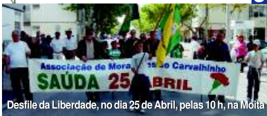
Desfile da Liberdade, no dia 25 de Abril, pelas 10 h, na Moita