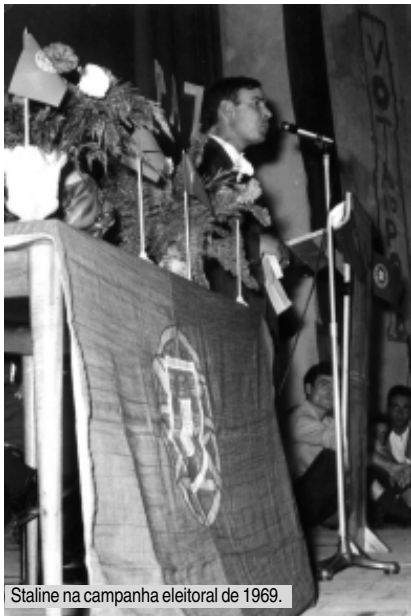
Staline na campanha eleitoral de 1969.

O nosso interlocutor diz-nos que o julgamento, no Tribunal Plenário, é um dado histórico interessantíssimo, onde são relatadas todas as torturas sofridas e os advogados de defesa, homens da oposição, têm intervenções de grande valor jurídico, humano e político. “Posições que mereciam ser mais divulgadas”