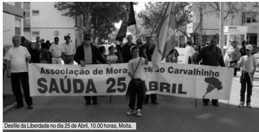
Desfile da Liberdade no dia 25 de Abril, 10.00 horas, Moita.

Ao todo são 35 as iniciativas que constituem os festejos do 25 de Abril, para comemorar os 31 anos da Revolução dos Cravos, na freguesia de Alhos Vedros.