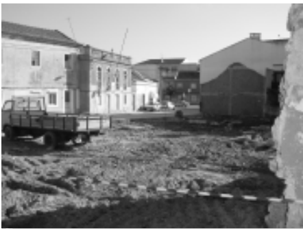
Terreno livre de edifícios.

Esta forma de actuar que a CMM, utiliza em Alhos Vedros, a política do quero, posso e mando acontecerá sempre, até que haja uma luta organizada e suprapartidária que nos volte a devolver a nossa identidade e a nossa independência como concelho.