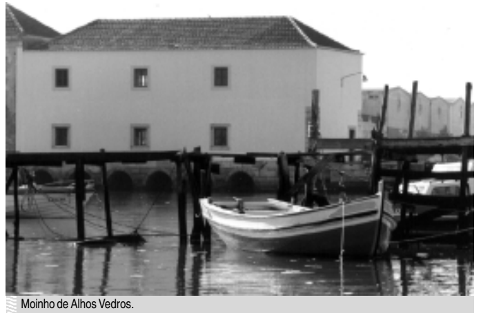
Moinho de Alhos Vedros.

Já peca por tardia a inexistência de um núcleo museológico, onde nós possamos ver ao vivo, a enorme quantidade de testemunhos de que dispomos sobre a História da nossa terra e que têm sido o fruto de um trabalho de carolice, com fracos apoios, dos nossos associativistas, historiadores, arqueólogos, antropólogos, entre outros, tan-