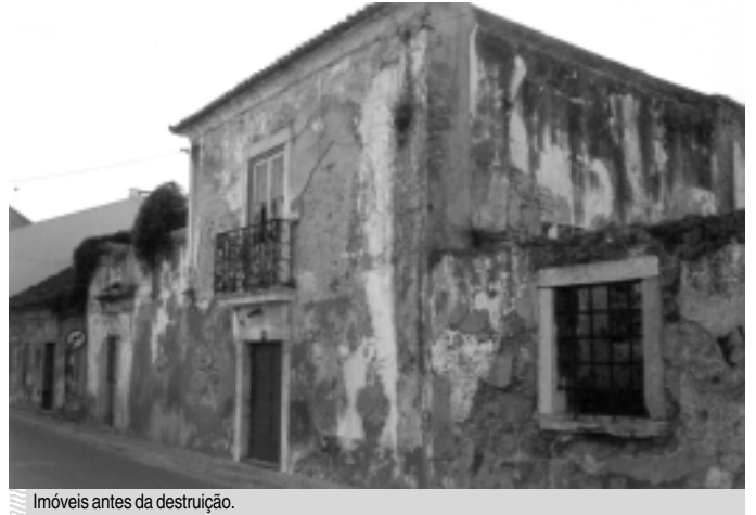
Imóveis antes da destruição.

O espólio da Stª Casa da Misericórdia de valor histórico e cultural, para acabar com a memória do passado nobre e ancestral desta localidade que já foi a sede do concelho que abrangia do Barreiro até à Aldeia Galega.